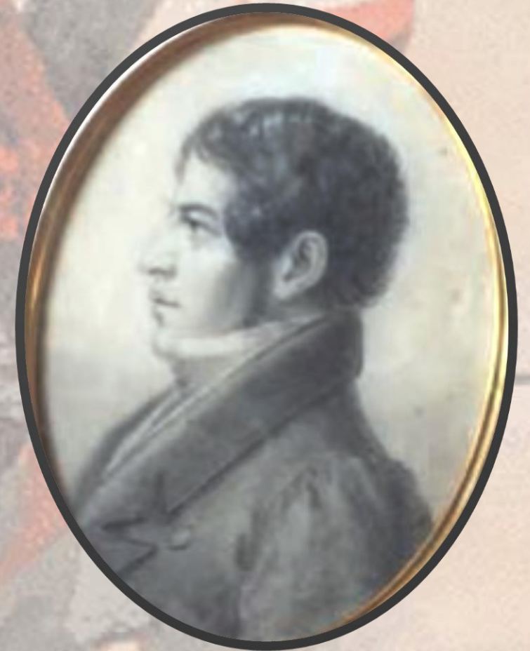
Probabile ritratto di Nicola Maria Magaldi

All'impegno come avvocato civilista nel foro di Potenza, accompagnò la passione politica e gli ideali unitari, fu infatti, come tutta la sua famiglia, strenuo sostenitore della lotta antiborbonica e contribuì attivamente al movimento insurrezionale in Basilicata.