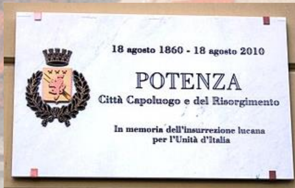
Targhe commemorative a Potenza