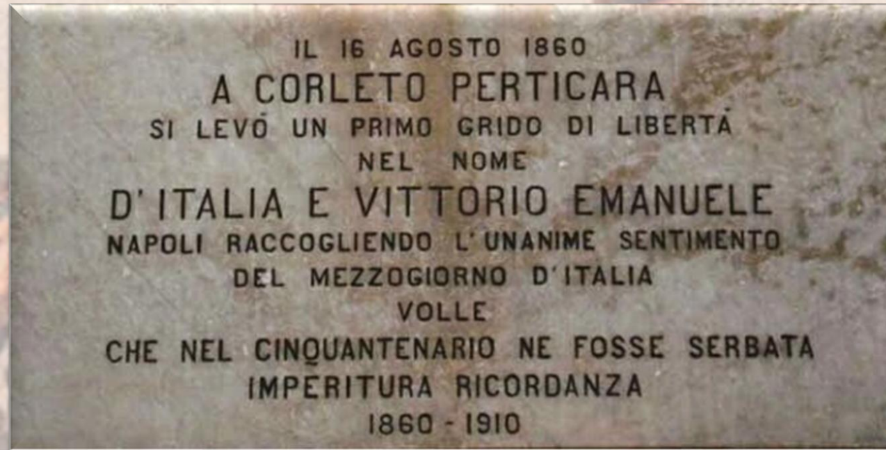
Lapide commemorativa a Corleto Perticara

La Basilicata fu la prima regione del Mezzogiorno continentale ad aderire all'Unificazione prima che Garibaldi attraversasse lo Stretto di Messina.